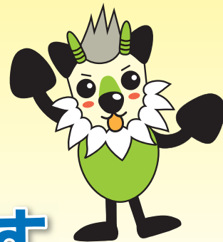
長野県消費者被害防止啓発 キャラクター モシカっち