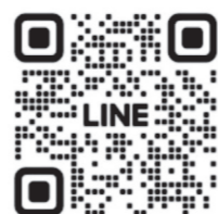
長野県 LINE 公式アカウント 「消費生活相談@長野県」